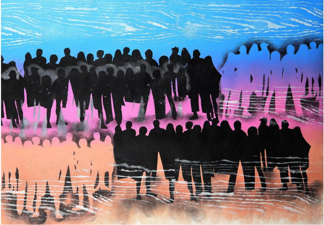
شكل رقم (8)

هي مجموعة متماسكة من الافراد بينهم تفاعل اجتماعي و أهداف مشتركة و تربطهم بيئة جغرافية، اقتصادية، اجتماعية، دينية...الخ و هناك فارق بين جمع مجموعة من الأفراد و بين الجماعة. في كون المصطلح الاول يشير الى تجاوز مكاني لبعض الافراد دون أن يحدث تفاعلاً من نوع ما، وقد يتحول التجمع الى جماعة اجتماعية عن طريق التفاعل الذي يحدث بين أولئك المتجاورين. ومن خصائص الجماعة بأنهم أفراد توحيد بينهم أنماط تفاعلية، تربطهم أهداف مشتركة، انفعالات و مشاعر مشتركة.