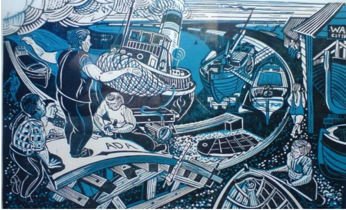
شكل رقم (2)

يعتمد التكوين على استخدام مجموعة من القوارب بأحجام واتجاهات ووضعيات مختلفة بحيث يبدو دور الأفراد في هذا العمل منصباً في حرفة الصيد لدى الفنان ، والذي تأثر بموروث العائلة في عملية الصيد ، حيث يؤدي الأفراد مهمتهم في تجهيز وربط أجزاء القوارب في عملية تعاون مع بعضهم للتحكم في وضعية السفينة من موج البحر . ويشاهد كبير السن في يسار اللوحة والذي يدل وضعيته على أنه مشرف على هذه العملية بينما باقي الأفراد منهمكين في ربط الشراع ولف الحبل وتنظيف القوارب . استخدام الفنان لونيْن : الأسود والازرق رمزاً للبحر والاسود لعملية التضاد وإبراز التفاصيل لموضوع اللوحة . ويؤكد موضوع اللوحة على التعاون بين افراد المجموعة سواء كانت عائلة أو العمل في الحرفة في مجال العمل نفسه و يتجلى ذلك في التفاعل الكبير بين الشكل والأرضية. إنه تعبير من خلال حركة الأفراد ووضعياتهم ، ازدحام العمل بعناصر السفن المختلفة ... هذا الزخم والتكثيف للعناصر في اللوحة يصف معني حقيقي من الحياة للمتلقي ، لكن برؤية متميزة للفنان من خلال صياغة العمل بهذا الشكل واستخدام اللون محددة .