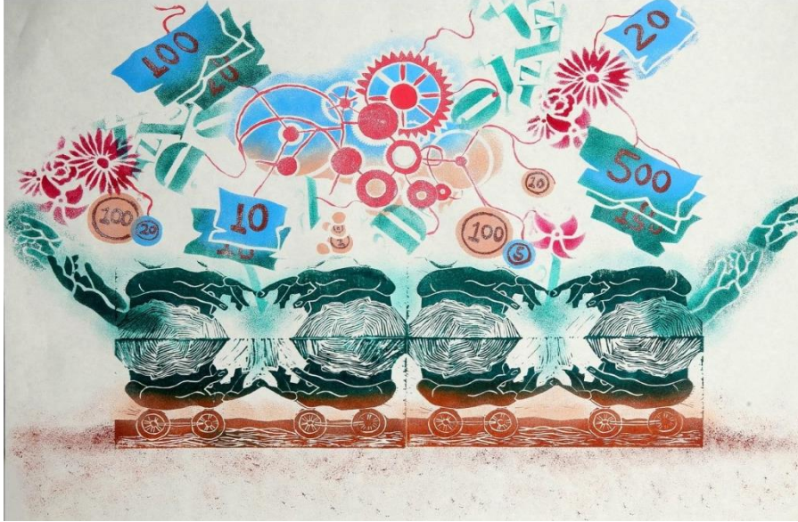
شكل رقم (11)

يتجلى معنى المساهمة في المشاركة، العطاء، اللغة، مد يد التعاون، العلم، الاتصال المادي، و المشاعر و الحب اللذان يؤديان الي طاقة متجددة في جوانب الحياة المتعددة. فالحب شكل من أشكال الطاقة الروحية، التي يمكن أن تتحول الي طاقة حركية دافعة.. ترتبط أيضاً بالأفعال .. و تنتج في نفس الوقت الطاقة الحركية أثناء تحركها و يستخدم لإنتاج طاقة إشعاعية تضئ الطريق. كما يخترن الزنبرك المضغوط الطاقة و حب العلم يمثل في المتعة في البحث و الاكتشاف و تقديم نتائجه في خدمة المجتمع و الوطن. أنها المضامين تترجم مفهوم المساهمة عند الفرد في المجتمع.