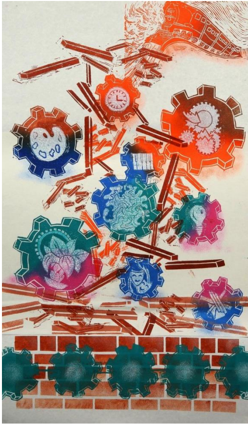
شكل رقم (12)

مفهوم التطوير هو التحويل من طور الي طور. و تعني كلمة تطوير تحول من طوره: أي التغيير التدريجي الذي يحدث في بنية الكائنات الحية و سلوكها. و يطلق أيضاً على التغيير التدريجي الذي يحدث في تركيب المجتمع أو العلاقات أو النظم أو القيم السائدة فيه. وهو مصطلح "تحسين" وصولاً الي تحقيق الأهداف المرجوة بصورة أكثر كفاءة.